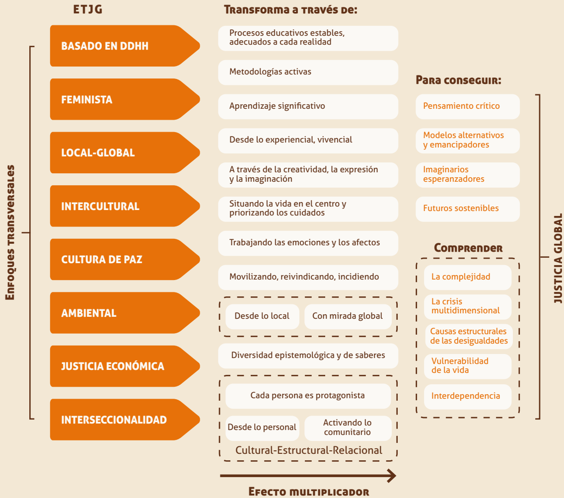
GRÁFICO 3 Enfoques, metodologías y fines en la ETJG